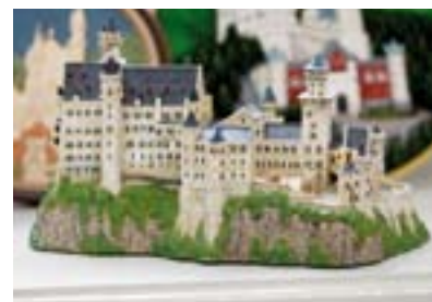
» Eines der vielen Schlossmodelle und Miniaturen im Besprechungsraum.