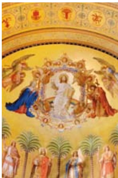
»Thronsaal in Schloss Neuschwanstein« Die Bilder in der Apsiszone zeigen Christus, die zwölf Apostel und sechs heilige Könige.

Es ist eine gesegnete Gegend – die Königsfamilie wusste schon, warum sie so oft hier her kam.